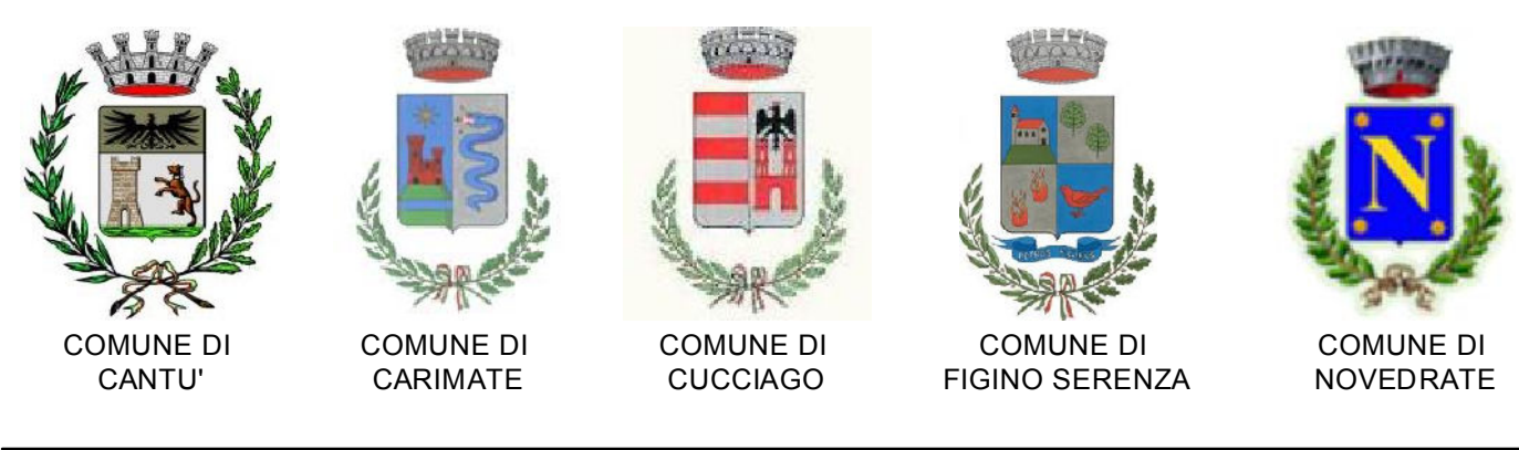
TAV. 4.B - CARTA DEL RISCHIO SISMICO COMUNE DI CARIMATE