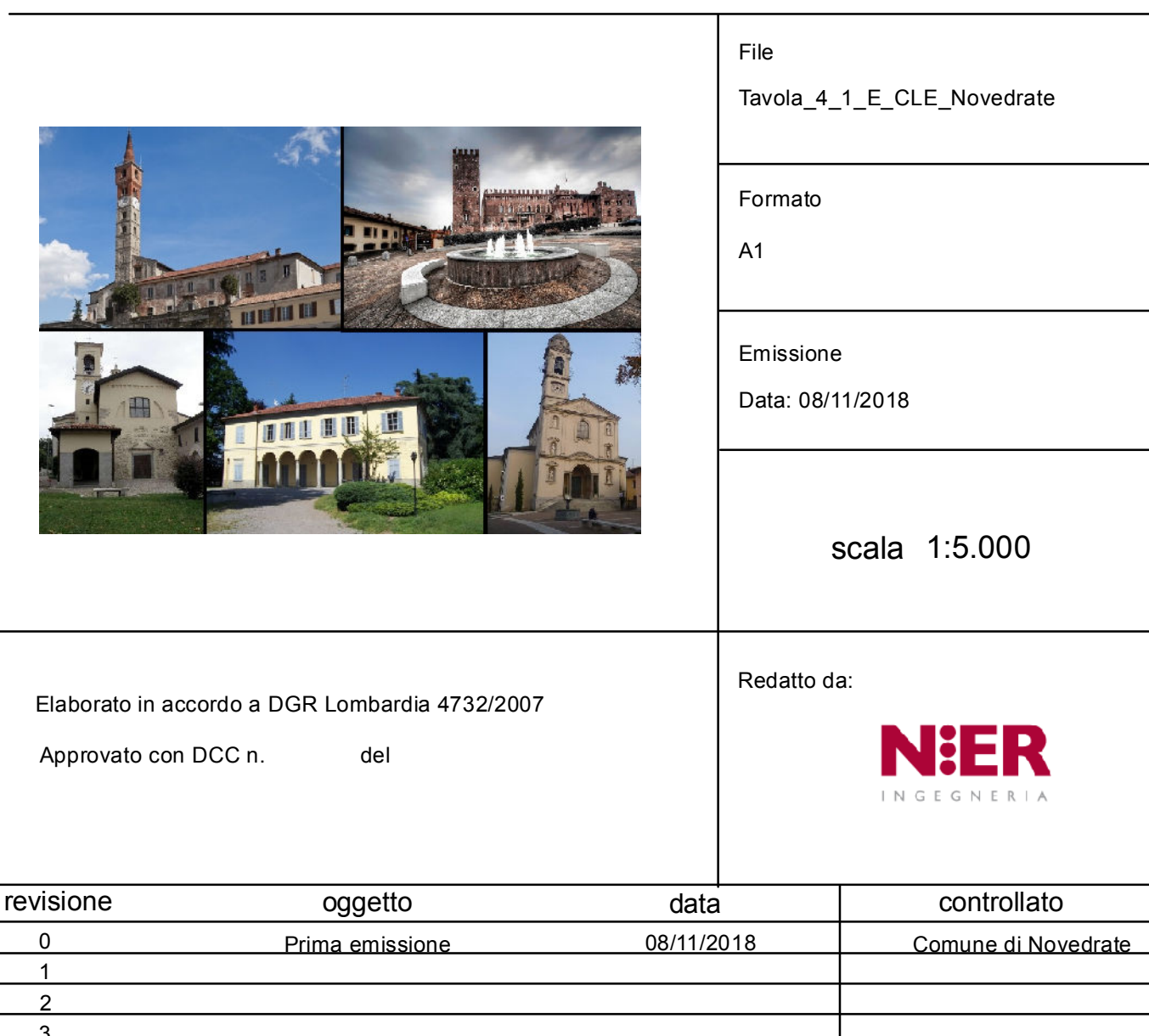
TAV. 4.1.E - CARTA PRELIMINARE DELLA CONDIZIONE LIMITE DELL'EMERGENZA COMUNE DI NOVEDRATE